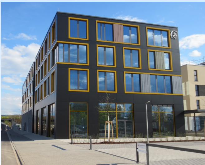
Das neue Kammergebäude in der Zimmerstraße